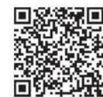
はたらくあさひかわ プラスQRコード