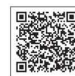
北見市 移住・定住情報 QRコード