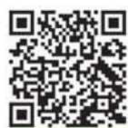
はたらくあさひかわ QRコード