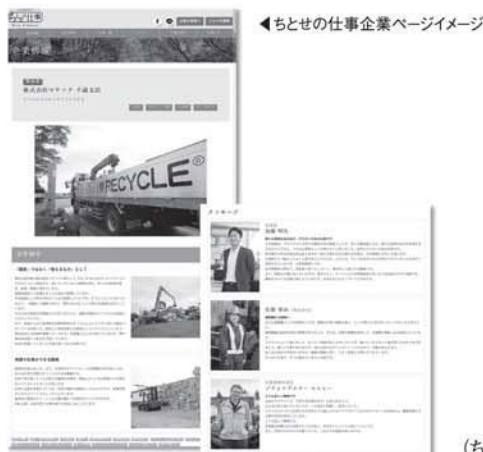
ちとせの仕事企業ページイメージ