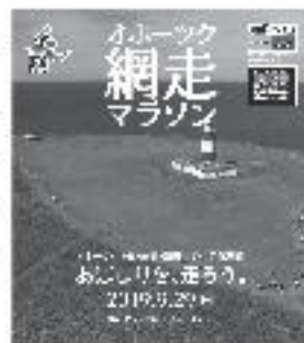
(第5回オホーツク網走マラソン)

また、U・Iターン情報については、インターネット検索「網走市U・Iターン者受入情報」や、ツイッターアカウント「あばマッチ(まちなか網走&網走市の就職情報)」にて随時発信していますので、ぜひご覧ください。